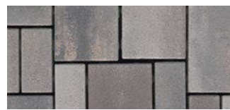
color Beluga-Grau fein*