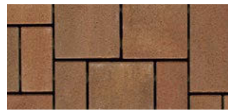
color Nevada-Rot fein*