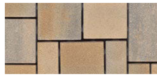
color Jura-Beige fein*