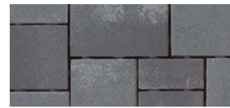
color Grafit fein*