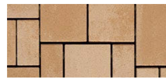
color Caramel fein*