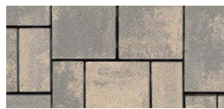
color Seidengrau fein*