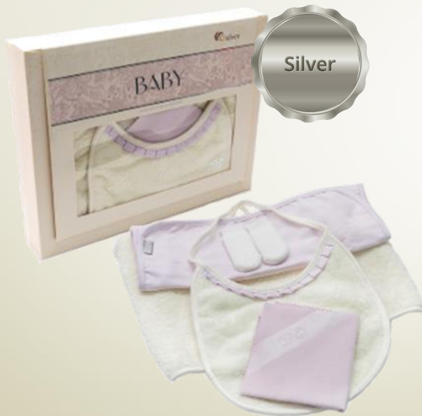
Set für Kinderpflege