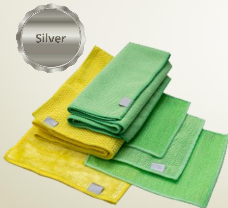
KÜCHENSET AQUAMAGIC ABSOLUTE