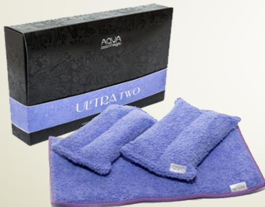
SET AQUAMAGIC ULTRA TWO