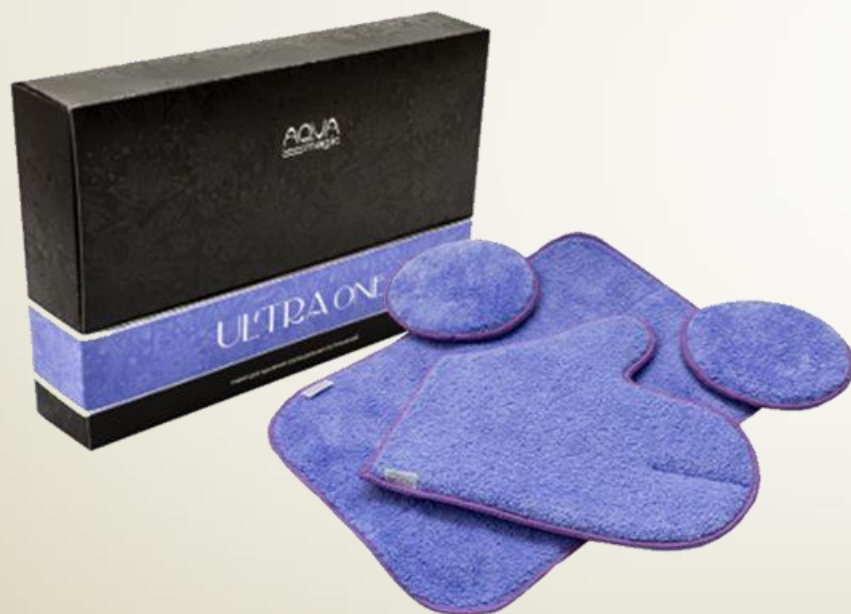
SET AQUAMAGIC ULTRA ONE