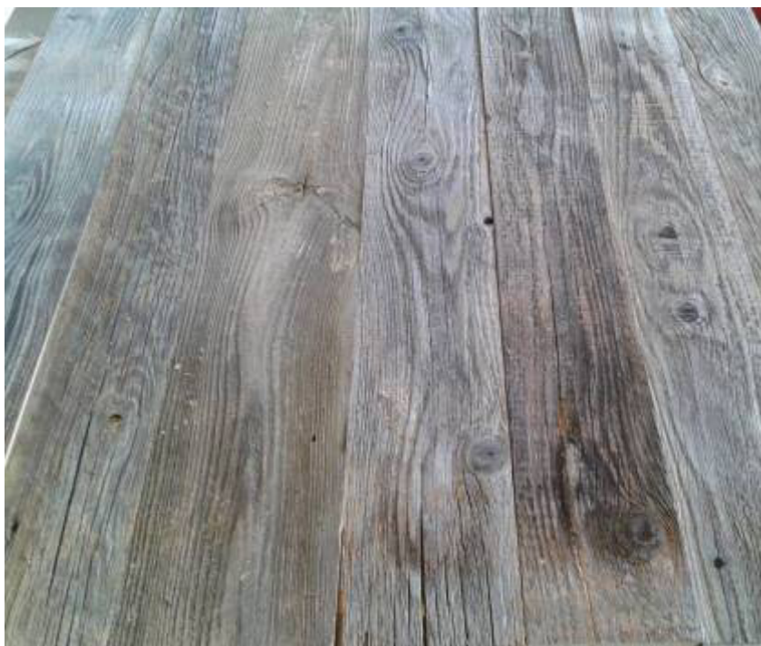
Original graue Oberfläche