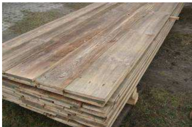
Einbaufertig aufbereitet, gebürstet grau