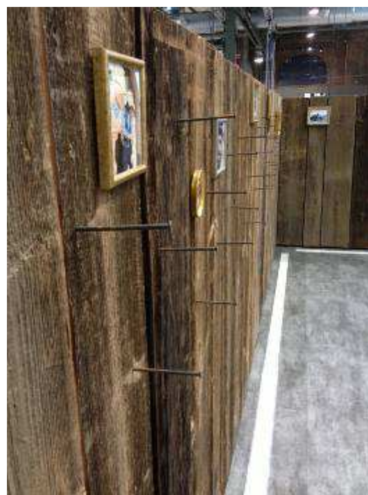
Original braune Oberfläche

Für den Versand von Musterstücken berechnen wir eine Pauschale von 10,00 €.