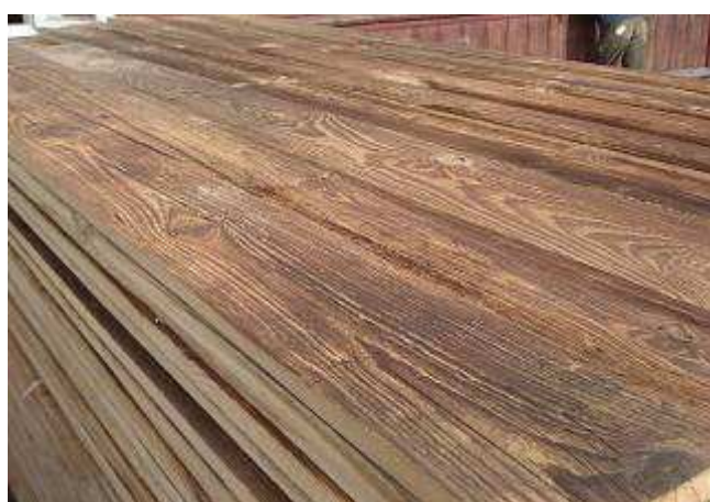
Einbaufertig aufbereitet, gebürstet braun