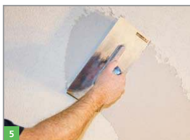
5 Optional Aufbringen des Feinputzes BOTAMENT® RENOVATION FP