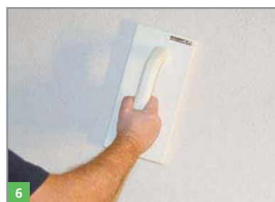
6 Glätten des Feinputzes BOTAMENT® RENOVATION FP