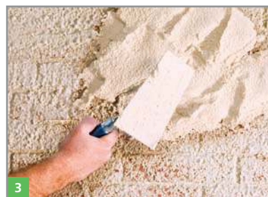
3 Aufbringen des Feuchtespezialputzes BOTAMENT® RENOVATION FSP Feuchtespezialputz