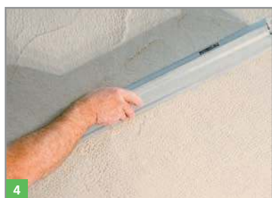
4 Glätten mit der Putzschiene