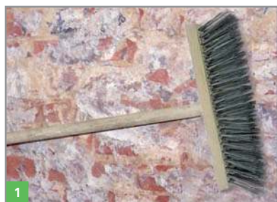
1 Vorbereitung des Untergrundes

Das Feuchtespezial-Putz-System BOTAMENT® RENOVATION kann direkt auf feuchtem Mauerwerk aufgetragen werden.