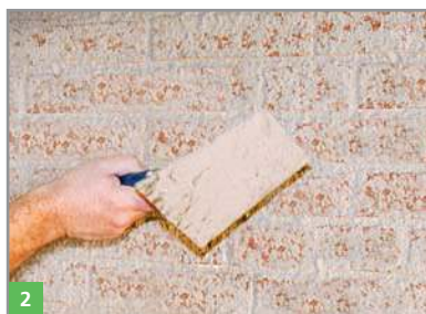
2 Netzförmiges Auftragen des Vorspritzmörtels BOTAMENT® RENOVATION VSM in Form eines Spritzbewurfs